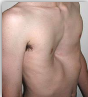
Figura 1. Paciente con Pectus excavatum

Ambas técnicas son altamente invasivas para el paciente.